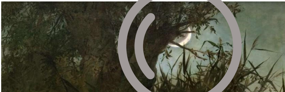
Witold Pruszkowski, Rusalki , fragm.

3. Skup się na tym, co jest na górze obrazu, i spróbuj wymyślić nowy tytuł – wyłącznie na podstawie wskazanego elementu.